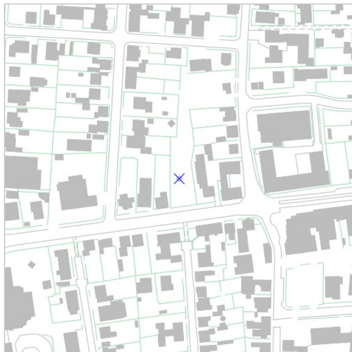
Kortet viser søgegeometrien inklusiv evt. bufferzone